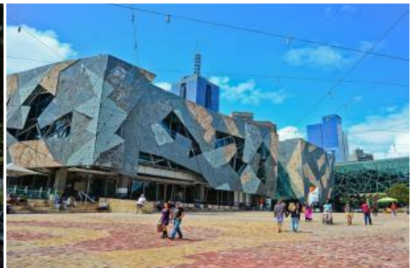
BW Australia Winter Snow 7D4N 28 JUL – 3 AUG 2026 by TG