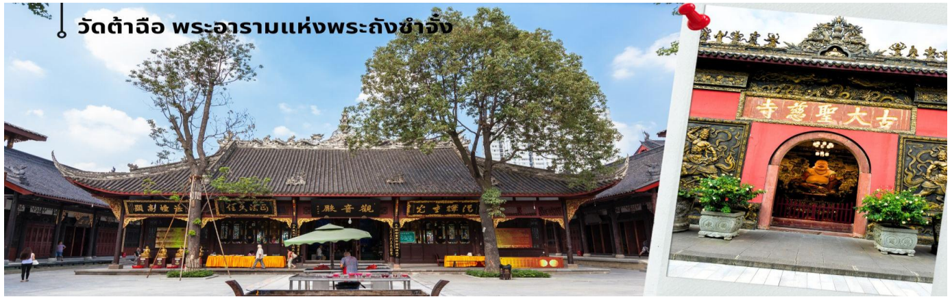
วัดต้าฉือ พระอารามแห่งพระถังซำจั๋ง

นำท่านเดินทางกลับเฉิงตู นำท่านชม วัดต้าฉือ พระอารามแห่งพระถังซำจั๋ง ใจกลางนครเฉิงตู พระถังซำจั๋ง ได้รับการสรรเสริญว่าเป็นผู้มีความเพียร และมีชื่อเสียงมายาวนานกว่า 1,400 ปี และยังได้รับการยกย่องว่าเป็นพระไตรปิฎกแห่งราชวงศ์ถัง พุทธประวัติของพระถังซำจั๋งถูกจารึกในสถานที่ต่างๆมากมาย รวมไปถึงได้ถูกกล่าวถึงในจดหมายเหตุหลายเล่ม ตามเส้นทางการเดินทางแห่งความเพียรของท่าน รวมทั้งมีพระอัฐิของท่าน ประดิษฐานอยู่ในพระอารามของนครนานจิง และที่ทะเลสาบสุริยันจันทราเป็นเกาะใต้หวนอีกด้วย