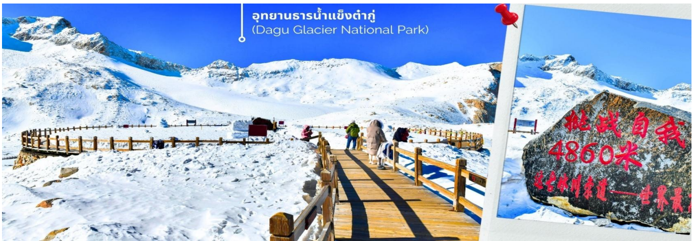
การตกและความหนาวของหิมะขึ้นอยู่กับสภาพอากาศ

จากนั้นนำท่านเดินทางสู่ เมืองเฮยสุ่ย (ใช้เวลาเดินทางประมาณ 2 ชั่วโมง)เพื่อเดินทางไปยัง อุทยานธารน้ำแข็งต้ากู่ปังชว่น(รวมกระเช้าขึ้นลง) ต้ากู่ปังชว่น หรือ Dagu Glacier National Park เป็นธารน้ำแข็งกลาเซียร์ที่สวยงามที่สุดแห่งหนึ่งของโลก และเป็นสถานที่ท่องเที่ยวระดับ 4A ของจีน ตั้งอยู่ที่เมืองเฮยสุ่ย ในมณฑลเสฉวน ห่างจากเมืองเฉิงตูประมาณ 300 กิโลเมตร ถือเป็นธารน้ำแข็งที่อายุน้อยที่สุด ที่ตั้งอยู่ในระดับความสูงที่ต่ำที่สุด และอยู่ใกล้กับเมืองมากที่สุดในบรรดาธารน้ำแข็งทั้งหมด โดยอยู่สูงจากระดับน้ำทะเลประมาณ 3,800-5,100 เมตร จุดสูงที่สุดที่นักท่องเที่ยวสามารถขึ้นไปได้จะอยู่ที่ 4,860 เมตร