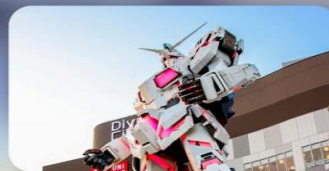
ซัปโปะโอไดบะ