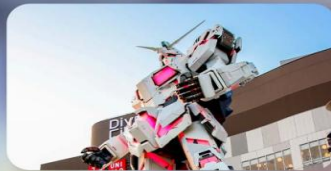
ซัปโปงโอไดบะ