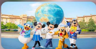
อิสระตามอัธยาศัย 2 วัน

HOTEL ASIA NARITA หรือเทียบเท่ามาตรฐานญี่ปุ่น