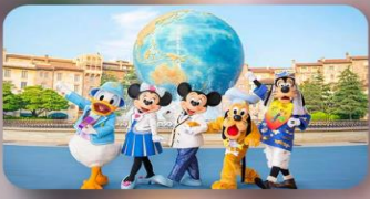
อิสระตามอัธยาศัย 2 วัน