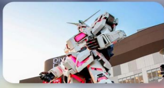
ซัปโปะโอไดบะ