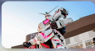
ซัปโปงโอไดบะ