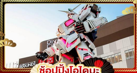
ช้อปปิ้งโอไดบะ