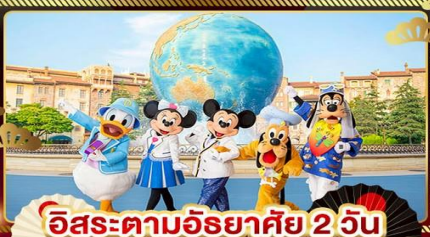
อิสระตามอัธยาศัย 2 วัน