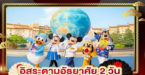
อิสระตามอัธยาศัย 2 วัน