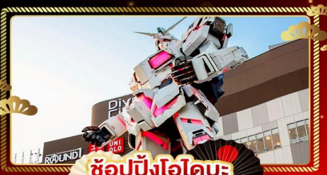
ช้อปปิ้งโอไดบะ