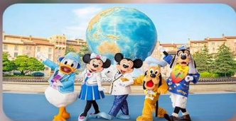
อิสระตามอัธยาศัย 2 วัน