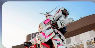
ช็อปปังไอบะ