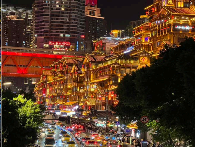
ค่า รับประทานอาหาร ณ ร้านอาหาร พิเศษ! เมนูหม่าล่าหม้อไฟ สไตลิ่งจีน

เลือกซื้อ OPTIONAL เสริม : ล่องเรือแม่น้ำเจียหลิงเจียง ราคาท่านละ 380 หยวน การล่องเรือที่แม่น้ำเจียหลิงเจียงในฉงชิ่ง เป็นส่วนหนึ่งของกิจกรรมล่องเรือชมวิวดวงแม่น้ำ (แม่น้ำแยงซีและแม่น้ำเจียหลิง) ที่จะนำชมทิวทัศน์ยามค่ำอันงดงามตระการตาของเมืองฉงชิ่ง รวมถึงแลนด์มาร์กสำคัญอย่าง หงหยาดัง และ สะพานเจาเทียนเหมิน การล่องเรือยามค่ำถือเป็นวิธีที่ดีที่สุดในการชื่นชมทัศนียภาพยามค่ำคืนของเมืองบนเนินเขาแห่งนี้พร้อมแสงไฟที่สาดเงาลงสู่ผิวน้ำ เมื่อเรือสำราญแล่นผ่าน ผิวน้ำจะกลายเป็นแถบสีสันต่างๆ