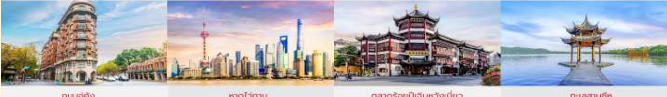
ถนนอู๋คัง