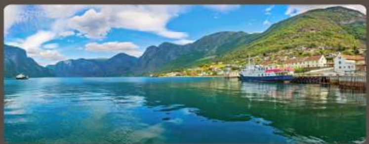
เส้นทางแสนสวย เมืองน่ารัก อากาศดีเยี่ยม

ทัวร์สแกนดิเนเวีย 10 วัน ชมทัศนียภาพที่สวยงามในการสัมผัสประสบการณ์แบบสแกนดิเนเวีย เริ่มต้นด้วยทัวร์เที่ยวชมเมืองโคเปนเฮเกน สํารวจเดนมาร์ก นอร์เวย์ ฟินแลนด์ และสวีเดน ในแต่ละจุดหมายปลายทาง การเดินทางด้วยรถโค้ช รถไฟ ชมวิว และล่องเรือชมฟยอร์ด สัมผัสประสบการณ์หมู่บ้าน ภูเขา และชนบทของเส้นทางในรูปแบบที่แตกต่างกัน พร้อมกับลิ้มรสอาหารท้องถิ่นหลากหลายเมนู