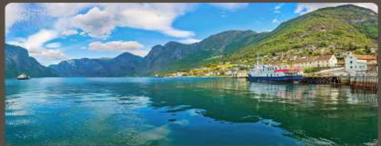
เส้นทางแสนสวย เมืองน่ารัก อากาศดีเยี่ยม

ทัวร์สแกนดิเนเวีย 10 วัน ชมทัศนียภาพที่สวยงามในการสัมผัสประสบการณ์แบบสแกนดิเนเวีย เริ่มต้นด้วยทัวร์เที่ยวชมเมืองโคเปนเฮเกน สำราญเดนมาร์ก นอร์เวย์ ฟินแลนด์ และสวีเดน ในแต่ละจุดหมายปลายทาง การเดินทางด้วยรถโค้ช รถไฟ ชมวิว และล่องเรือชมวิวฟยอร์ด สัมผัสประสบการณ์หมู่บ้าน กูเฮา และชนบทของเส้นทางในรูปแบบที่แตกต่างกัน พร้อมกับลิ้มรสอาหารท้องถิ่นหลากหลายเมนู