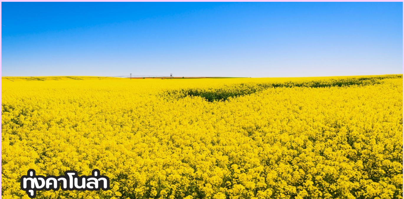
ทุ่งคาโนล่า

ที่พัก Holiday Inn Express หรือเทียบเท่าระดับ 4 ดาวจีน