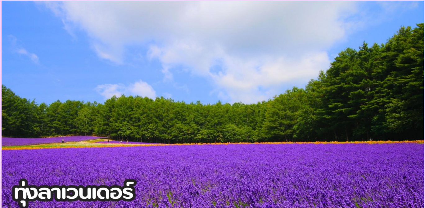
ทุ่งลาเวนเดอร์