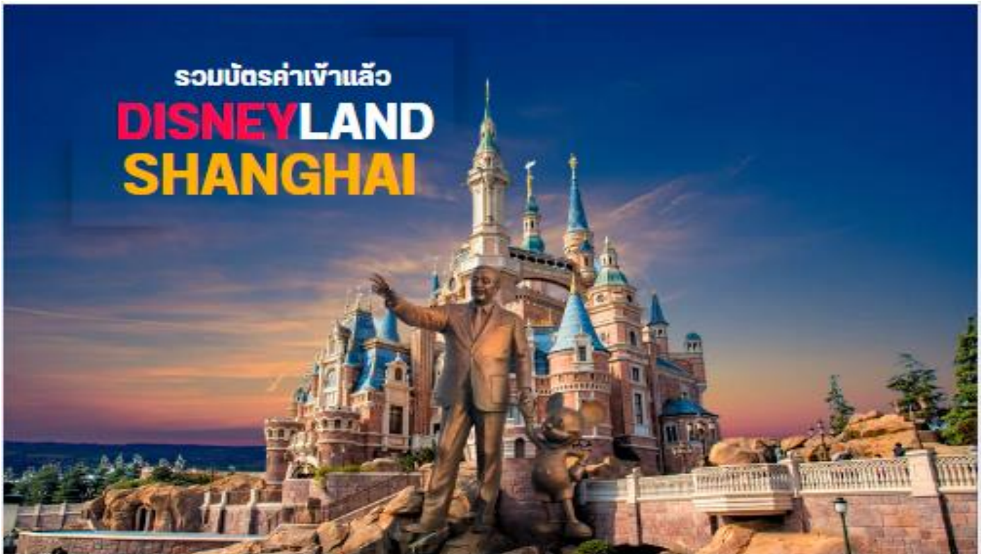
DISNEYLAND SHANGHAI ดิสนีย์แลนด์เชียงไฮ้

นำท่านสู่ เชียงไฮ้ดิสนีย์แลนด์สวนสนุก แห่งที่ 6 ของดิสนีย์ฯ มีขนาดใหญ่อันดับ 2 ของโลก รองจากดิสนีย์แลนด์ในออร์แลนโด รัฐฟลอริดา สหรัฐอเมริกา และเป็นสวนสนุกดิสนีย์แลนด์แห่งที่ 3 ในเอเชีย ตั้งอยู่ในเขตฉวนซา ใกล้กับแม่น้ำหวงผู่ และสนามบินผู้ตง สวนสนุกเชียงไฮ้ดิสนีย์แลนด์ มีขนาดใหญ่กว่าฮ่องกงดิสนีย์แลนด์ถึง 3 เท่า ใช้เวลาร่วม 5 ปีในการก่อสร้าง โดยใช้บั้งทั้งสิ้นราว 5.5 พันล้านเหรียญ หรือราว 180,000 ล้านบาท สวนสนุกแห่งนี้เป็นที่พำนักของดิสนีย์ร้อยละ 43 ที่เหลือเป็นของ ช่งไห้ เส้นตี้ กรุ๊ป กิจการรัฐวิสาหกิจจีน รวมถึงภาคส่วนต่างๆ ที่อัดฉีดเงินสนับสนุนเพื่อช่วยกันแสวงหากำไรในอนาคต ในสวนสนุกมีไฮไลท์ประกอบด้วย Enchanted Storybook Castle ปราสาทดิสนีย์ที่ใหญ่ที่สุดในโลก และมีทั้งหมด 6 อิมพาร์คด้วยกัน ทั้ง Adventure Isle, Mickey Avenue, Gardens of Imagination, Tomorrowland, Treasure Cove และ Fantasyland มีสารพัดเครื่องเล่นหวาดเสียว และแหล่งรวมความบันเทิงที่น่าสนใจ