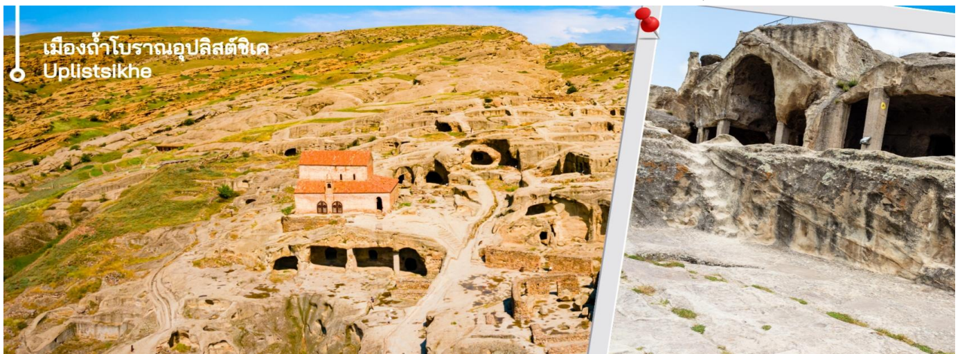
เมืองถ้ำโบราณอุปลิสต์ซิค Uplistsikhe

นำท่านเดินทางชมถ้ำโบราณ เมืองถ้ำโบราณอุปลิสต์ซิค ได้รับการระบุโดยนักโบราณคดีว่าเป็นหนึ่งในแหล่งที่อยู่อาศัยในเมืองที่เก่าแก่ที่สุดในจอร์เจีย ถ้ำส่วนใหญ่ไม่มีการตกแต่งใดๆ แม้ว่าโครงสร้างขนาดใหญ่บางแห่งจะมีเพดานโค้งแบบอูโมงค์ที่แกะสลักหินเลียนแบบท่อนซุง โครงสร้างขนาดใหญ่บางแห่งยังมีช่องเล็กๆ อยู่ด้านหลังหรือด้านข้าง ซึ่งอาจใช้สำหรับพิธีกรรม ด้านหน้าของห้องโถงพิธีกรรมขนาดใหญ่ทางตอนใต้ตกแต่งด้วยซุ้มโค้งแบบโรมันที่มีหน้าจั่วมหาวิหารในศตวรรษที่ 6 ส่วนใหญ่แกะสลักเข้าไปในหิน ยกเว้นกำแพงด้านใต้ที่สร้างจากหิน ที่จุดสูงสุดของบริเวณนั้นมีมหาวิหาร คริสเตียน ที่สร้างด้วยหินและอิฐในศตวรรษที่ 9-10 การขุดค้นทางโบราณคดีได้ค้นพบสิ่งประดิษฐ์มากมายจากยุคต่างๆ รวมถึงเครื่องประดับทองคำ เงิน และทองสัมฤทธิ์ ตลอดจนตัวอย่างเครื่องปั้นดินเผาและประติมากรรม สิ่งประดิษฐ์เหล่านี้ได้รับการเก็บรักษาไว้ในพิพิธภัณฑสถานแห่งชาติในกรุงทбилиซี