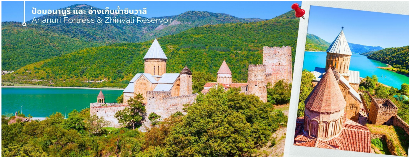
ป้อมอนาบุรี และ อ่างเก็บน้ำชินวาลี Ananuri Fortress & Zhinvali Reservoir

ทหารไปตามกาลเวลา แต่ยังคงเป็นสัญลักษณ์แห่งอดีตอันรุ่งเรืองของจอร์เจีย และได้รับการยกย่องให้เป็นมรดกโลกของยูเนสโกอย่างภาคภูมิใจ