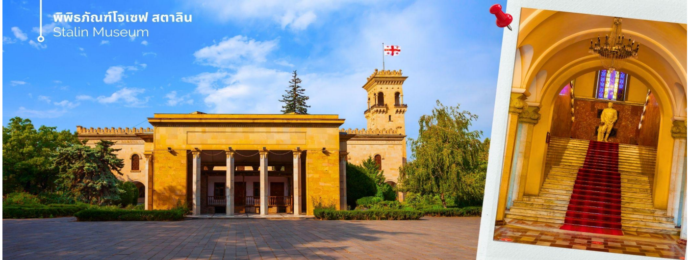
พิพิธภัณฑสถานโจเซฟ สตาลิน Stalin Museum

นำท่านเที่ยวชม พิพิธภัณฑสถานโจเซฟ สตาลิน (Stalin Museum) ซึ่งเมืองนี้เป็นบ้านเกิดของโจเซฟ สตาลิน อดีตผู้นำสูงสุดของสหภาพโซเวียต สตาลินถูกยกย่องเป็นวีรบุรุษที่นำพาสหภาพโซเวียตให้รุ่งเรือง แต่ในขณะเดียวกันก็เป็นที่รู้จักในด้านการกดขี่ข่มเหงและการฆ่าล้างเผ่าพันธุ์ พิพิธภัณฑสถานแห่งนี้จึงเป็นแหล่งเรียนรู้เกี่ยวกับชีวิตและผลงานของสตาลิน รวมถึงผลกระทบที่เขามีต่อประวัติศาสตร์โลก