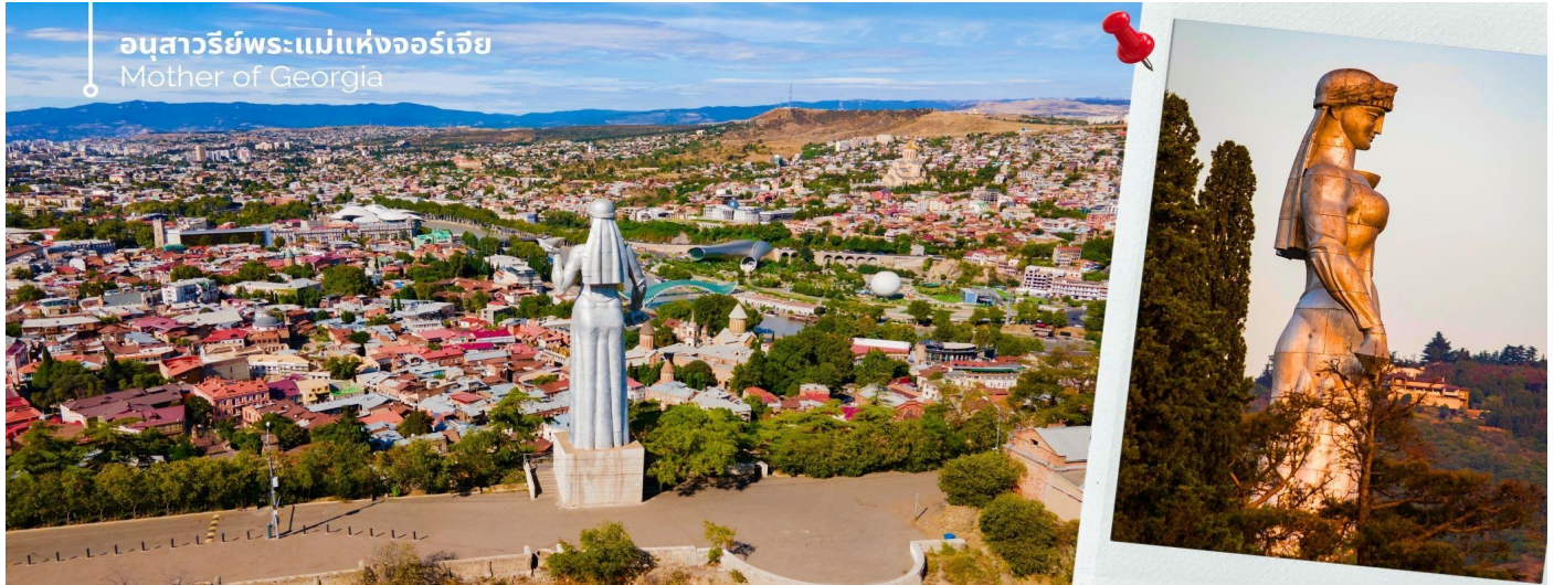
อนุสาวรีย์พระแม่แห่งจอร์เจีย Mother of Georgia

นำท่านถ่ายภาพที่ โรงอาบน้ำโบราณอะบาโนตูบานิ (Abanotubani) ซึ่งตั้งอยู่ในย่านโรงอาบน้ำพุร้อนเก่าแก่ในเมืองทบิลีซี ที่มีชื่อเสียงโด่งดังในเรื่องของน้ำพุร้อนที่มีแร่กำมะถัน เชื่อว่ามีสรรพคุณทางยา ช่วยรักษาโรคผิวหนัง และอาการปวดเมื่อยต่างๆ ที่นี้มีสถาปัตยกรรมที่สวยงามและเป็นเอกลักษณ์ มักจะตกแต่งด้วยโดมสีน้ำตาลใสที่สร้างจากอิฐ