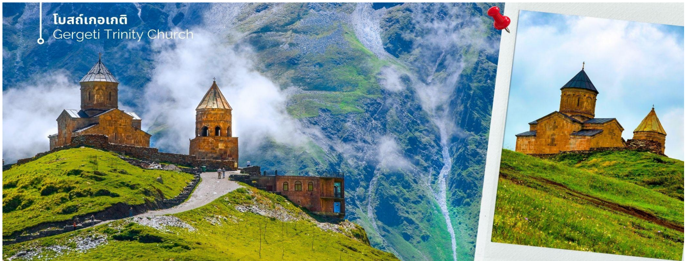
โบสถ์เกอเกติ Gergeti Trinity Church

จากนั้นนำท่านเดินทางด้วย รถจี๊ป 4x4 FWD เทียวชมความงดงามของ โบสถ์เกอเกติ (Gergeti Trinity Church) โบสถ์คริสต์นิกายออร์ทอด็อกซ์เก่าแก่ที่ตั้งอยู่บนยอดเขาสูงเป็นสัญลักษณ์และแลนด์มาร์คของประเทศจอร์เจียที่ผู้คนรู้จักกันไปทั่วโลก ถือว่าเป็นมรดกทางวัฒนธรรมและประวัติศาสตร์ที่ยิ่งใหญ่ สร้างขึ้นในศตวรรษที่ 14 อายุกว่า 600 ปี ตั้งอยู่บนความสูง 2,170 เมตร เหนือระดับน้ำทะเลใกล้กับหมู่บ้านเกอร์เกติที่อยู่ห่างออกไปเพียง 1 กิโลเมตร มีไฮไลต์ คือทิวทัศน์ของเทือกเขาคอเคซัสเป็นฉากหลังที่ชวนตราตรึง ในอดีตโบสถ์แห่งนี้เคยเป็นที่หลบภัยของชาวบ้านในยามเกิดภัยสงครามและเป็นที่ยึดรักษาสมบัติล้ำค่าของชาติ รวมถึงไม้กางเขนของนักบุญนิโน ในช่วงยุคโซเวียตที่ศาสนาถูกปราบปราม จนกระทั่งกลายมาเป็นศูนย์กลางทางศาสนาที่สำคัญของชาวจอร์เจียมาจนถึงปัจจุบัน