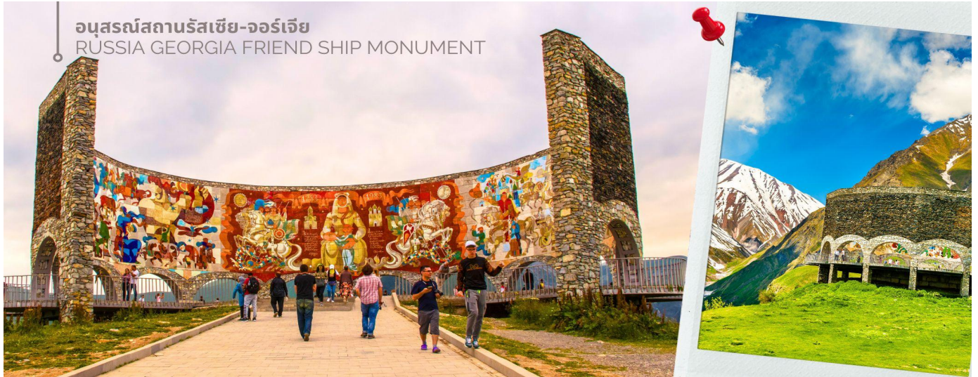
อนุสรณ์สถานรัสเซีย-จอร์เจีย RUSSIA GEORGIA FRIEND SHIP MONUMENT

จากนั้นนำท่านเดินทางด้วย รถจี๊ป 4x4 FWD เทียวชมความงดงามของ โบสถ์เกอเกติ (Gergeti Trinity Church) โบสถ์คริสต์นิกายออร์ทอด็อกซ์เก่าแก่ที่ตั้งอยู่บนยอดเขาสูงเป็นสัญลักษณ์และแลนด์มาร์คของประเทศจอร์เจียที่ผู้คนรู้จักกันไปทั่วโลก ถือว่าเป็นมรดกทางวัฒนธรรมและประวัติศาสตร์ที่ยิ่งใหญ่ สร้างขึ้นในศตวรรษที่ 14 อายุกว่า 600 ปี ตั้งอยู่บนความสูง 2,170 เมตร เหนือระดับน้ำทะเลใกล้กับหมู่บ้านเกอร์เกติที่อยู่ห่างออกไปเพียง 1 กิโลเมตร มีไฮไลต์ คือทิวทัศน์ของเทือกเขาคอเคซัสเป็นฉากหลังที่ชวนตราตรึง ในอดีตโบสถ์แห่งนี้เคยเป็นที่หลบภัยของชาวบ้านในยามเกิดภัยสงครามและเป็นที่ยึดรักษาสมบัติล้ำค่าของชาติ รวมถึงไม้กางเขนของนักบุญนิโน ในช่วงยุคโซเวียตที่ศาสนาถูกปราบปราม จนกระทั่งกลายมาเป็นศูนย์กลางทางศาสนาที่สำคัญของชาวจอร์เจียมาจนถึงปัจจุบัน