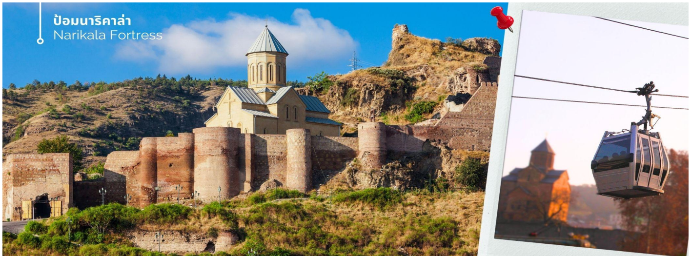
ป้อมนาริกาล่า Narikala Fortress

จากนั้นนำท่านขึ้นกระเช้าลอยฟ้าชม ป้อมนาริกาล่า (Narikala Fortress) (ร่วมค่ากระเช้า ขึ้น-ลง) ป้อมปราการโบราณขนาดใหญ่ที่ตั้งอยู่บนยอดเขา สามารถมองเห็นกำแพงเมือง และวิวทิวทัศน์ของเมืองด้านล่างได้แบบพาโนรามา โดยป้อมนี้มีประวัติศาสตร์ยาวนานกว่า 1,700 ปี ตั้งแต่ศตวรรษที่ 4 โดยชื่อ "นาริกาลา" ในภาษาเปอร์เซียมีความหมายว่า "ป้อมที่ไม่สามารถตีแตก" ซึ่งสะท้อนให้เห็นถึงความแข็งแกร่งและความสำคัญของป้อมแห่งนี้ในอดีต แม้ว่าเคยเสียหายจากแผ่นดินไหว เหลือเพียงซากปรักหักพัง แต่ก็มีการบูรณะโบสถ์ภายในป้อมขึ้นมาใหม่