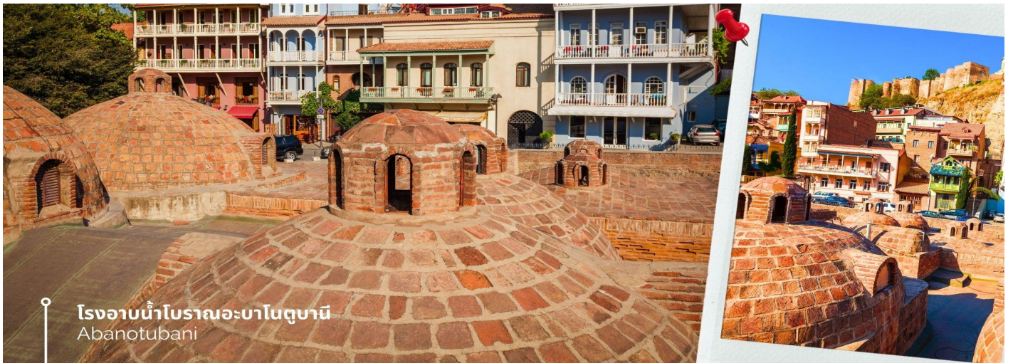
โรงอาบน้ำโบราณอะบาโนตูบานิ Abanotubani

นำท่านถ่ายภาพที่ โรงอาบน้ำโบราณอะบาโนตูบานิ (Abanotubani) ซึ่งตั้งอยู่ในย่านโรงอาบน้ำพุร้อนเก่าแก่ในเมืองทบิลีซี ที่มีชื่อเสียงโด่งดังในเรื่องของน้ำพุร้อนที่มีแร่กำมะถัน เชื่อว่ามีสรรพคุณทางยา ช่วยรักษาโรคผิวหนัง และอาการปวดเมื่อยต่างๆ ที่นี้มีสถาปัตยกรรมที่สวยงามและเป็นเอกลักษณ์ มักจะตกแต่งด้วยโดมสีน้ำตาลใสที่สร้างจากอิฐ