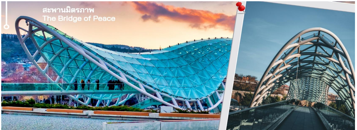
สะพานมิตรภาพ The Bridge of Peace

ก่อตั้งเมืองวกตัง กอร์กากาลีและป้อมนาริกาลาทางด้านหนึ่งและสะพานบาราตาชวิลีและพระราชวังพิธิการของจอร์เจียทางอีกด้านหนึ่ง