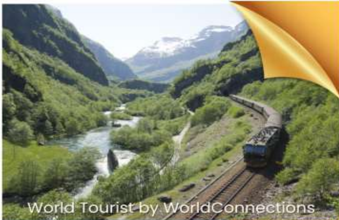
World Tourist by WorldConnections