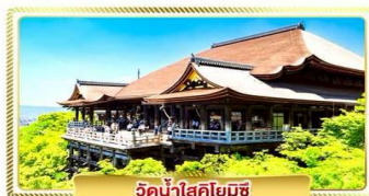
วัดน้ำใสคิโยมิสึ