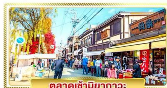
ตลาดเข้ามียากาวะ