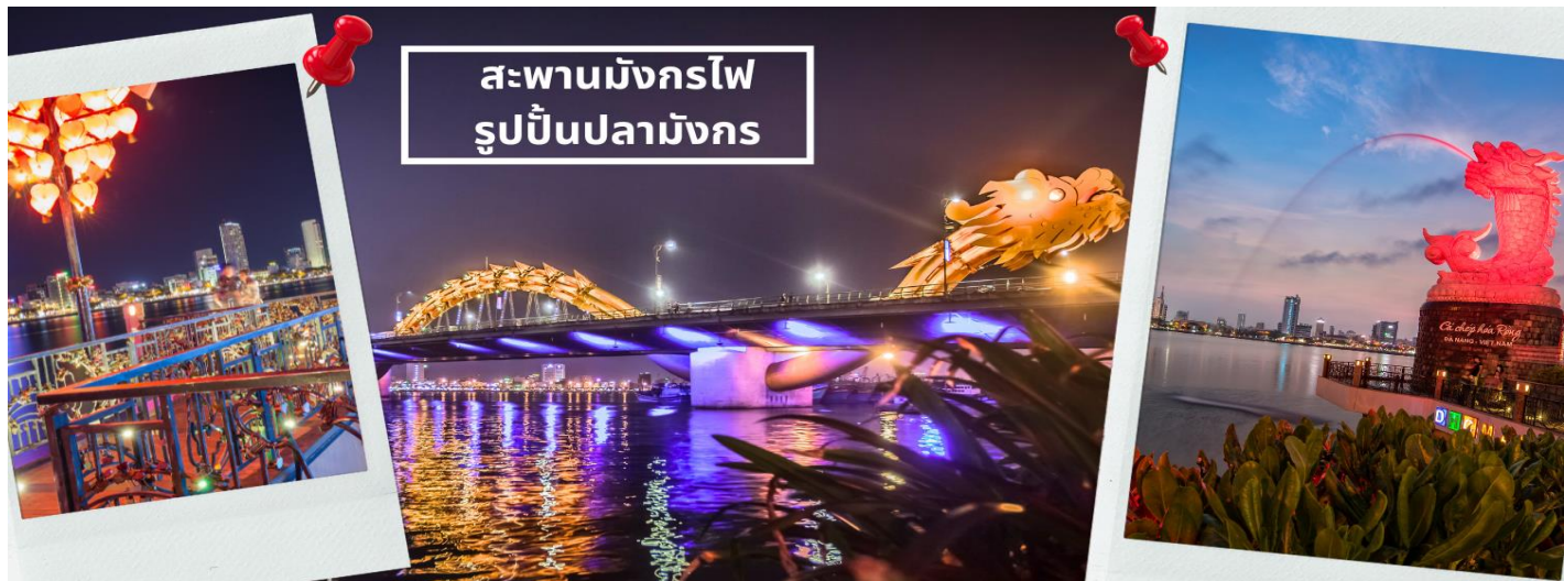
สะพานมังกรไฟ รูปปั้นปลามังกร

จากนั้นนำท่านชม สะพานแห่งความรัก ที่นิยมของหนุ่มสาวคู่รักกันมาซื้อกุญแจใส่คล้องใส่สะพาน จากนั้นนำท่านชม รูปปั้นปลามังกร ที่เป็นสัญลักษณ์ของเมืองดานัง เมืองที่กำลังจะกลายเป็นมังกรในระยะใกล้แห่งเอเชีย ตะวันออกเฉียงใต้ เชิญท่านเพลิดเพลินกับความอลังการของ สะพานมังกรไฟ ที่มีความยาวถึง 666 เมตร เป็นสะพาน 6 เลนส์ ซึ่งเป็นสะพานที่ตระการตามากที่สุดของเวียดนามในเวลานี้โดยการแสดงนี้จะเริ่มเวลา 21.00น. ของวันเสาร์และอาทิตย์เท่านั้น