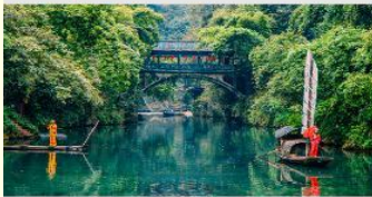
หมู่บ้านซานเสี่ยเหรินเจีย