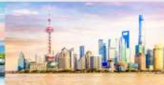
หาดไว่กาน