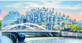
อาคารพินตันไม้