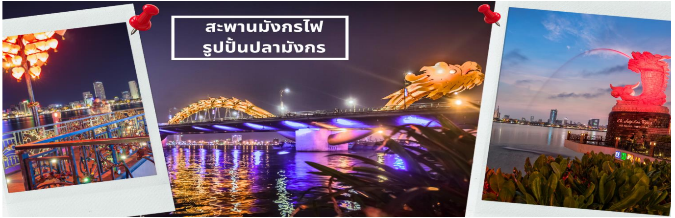
สะพานมังกรไฟ รูปปั้นปลามังกร

นำท่านเข้าสู่ที่พัก MAGNOLIA HOTEL หรือเทียบเท่าระดับ 4 ดาว