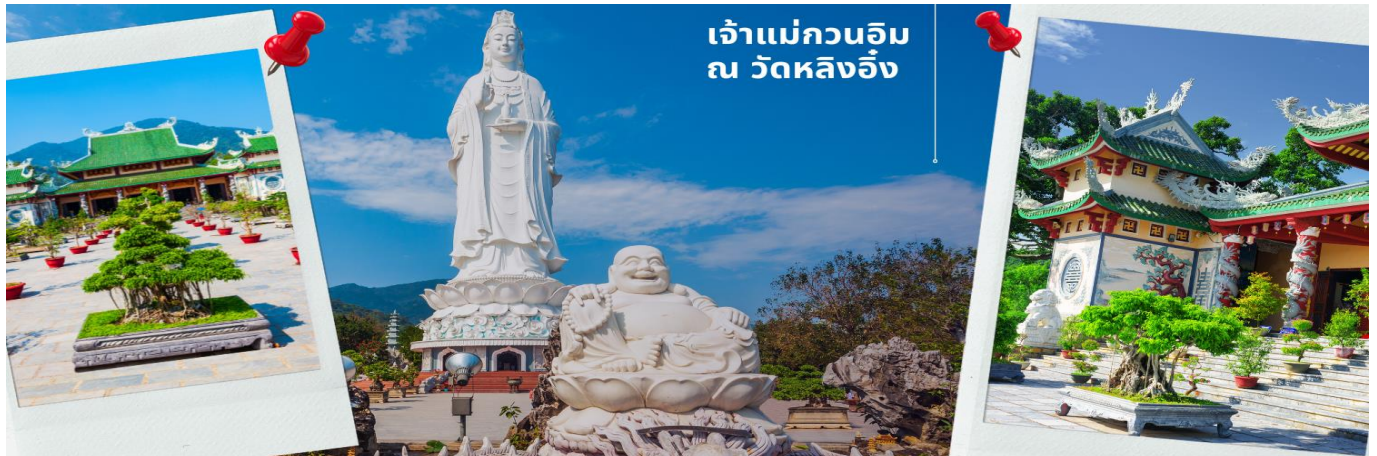
เจ้าแม่กวนอิม ณ วัดหลิงอิ่ง

นำท่านมีสักการองค์ เจ้าแม่กวนอิม ณ วัดหลิงอิ่ง อยู่บนเกาะเซินตรา (Son Tra) ทางเหนือของเมืองดานัง เป็นวัดใหญ่ที่สุดของที่นี่ รูปปั้นปูนขาวของเจ้าแม่กวนอิมยืนหันหลังให้ภูเขา หันหน้าออกสู่ทะเลเพื่อเป็นการปกป้องคุ้มครองชาวประมงที่ออกไปหาปลา เสียงระฆังวัดที่ตีประสานกับเสียงคลื่นนั้นช่วยให้ชาวเรือรู้สึกสงบ และสร้างขวัญกำลังใจอย่างดีเยี่ยม และเป็นที่เคารพนับถือของคนดานัง