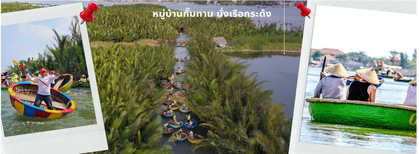
หมู่บ้านกัมทาน นั่งเรือกระดิง

จากนั้นนำท่านผ่านชม ภูเขาหินอ่อน Marble Mountains นำท่านเดินทางสู่ หมู่บ้านกัมทาน สนุกสนานไปกับการเล่นกิจกรรม นั่งเรือกระดิง เป็นหมู่บ้านเล็กๆในเมืองฮอยอันตั้งอยู่ในสวนมะพร้าวริมแม่น้ำ ในอดีตช่วงสงครามที่นี่เป็นที่พักอาศัยของเหล่าทหาร อาชีพหลักของคนที่นี่คืออาชีพประมง ระหว่างการล่องเรือท่านจะได้ชมวัฒนธรรมอันสวยงาม ชาวบ้านจะขับร้องเพลงพื้นเมือง ผู้ชายกับผู้หญิงจะหยอกล้อกันไปมานำที่พายเรือมาเคาะกันเป็นจังหวะดนตรีสุดสนุกสนาน จากนั้นนำท่านเดินทางสู่ เมืองโบราณฮอยอัน เทียบชมเมืองมรดกโลก