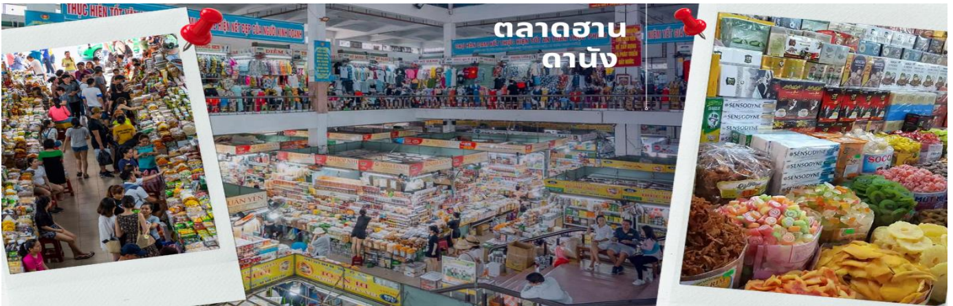
ตลาดฮาน ดานัง

นำท่านไปละลายทรัพย์ที่ ตลาดฮาน เป็นตลาดที่รวบรวมสินค้ามากมายเป็นที่นิยมทั้งชาวเวียดนามและชาวไทย อาทิ เสื้อเวียดนาม หมวก รองเท้า กระเป๋า สินค้าพื้นเมือง โดยเฉพาะงานฝีมือ อาทิ ภาพผ้าปักมืออัน