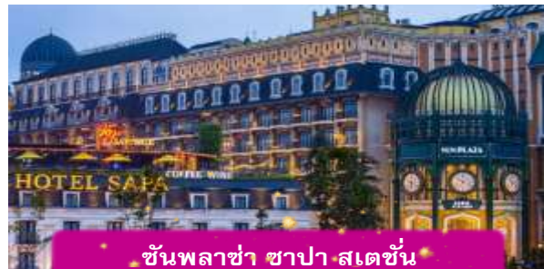
ชั้นพลาซ่า ซาปา สเตชั่น