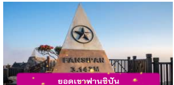
ยอดเขาฟานซิปัน