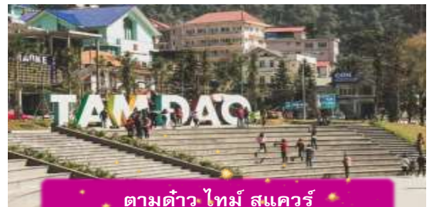
ตามดาว ไทม์ สแควร์

อิสระท่าน ตลาดกลางคืนตามดาว เมื่อแสงแดดลับขอบเขา เมืองบนดอยแห่งนี้จะค่อย ๆ เปลี่ยนบรรยากาศเป็นความคึกคักแบบเรียบง่าย ตลาดกลางคืนตามดาวเต็มไปด้วยของกินพื้นเมือง กลิ่นหอมของหมูย่าง ไชนักรักษา และข้าวโพดย่างลอยคลุ้งไปทั่ว นักท่องเที่ยวเดินจับจ่าย พุดคุย และหยุดถ่ายรูปตามแสงไฟที่ประดับอยู่ทั่วตลาด บรรยากาศเป็นกันเองและอบอุ่น เหมาะกับการเดินเล่น ปิดท้ายวันด้วยความสุขเล็กๆ ที่สัมผัสได้