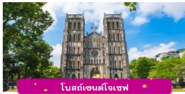
โบสถ์เซนต์โจเซฟ