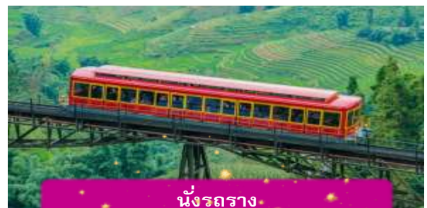
นั่งรถราง

เที่ยง บริการอาหารกลางวัน ณ ภัตตาคาร พิเศษ ... เมนูบุฟเฟ่ฟานซิปัน