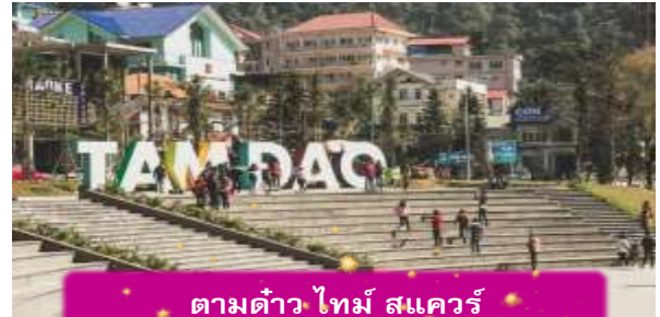
ตามด้าว ไทม์ สแควร์

ที่พัก TAMDAO HOTEL ระดับ 3 ดาวมาตรฐานท้องถิ่น หรือเทียบเท่า