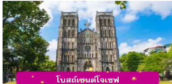
โบสถ์เซนต์โจเซฟ