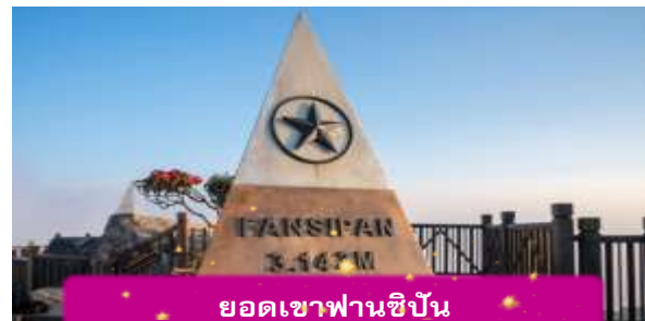
ยอดเขาฟานซิปัน