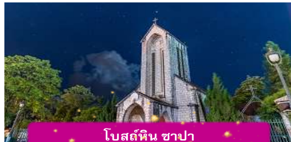
โบสถ์หิน ซาปา