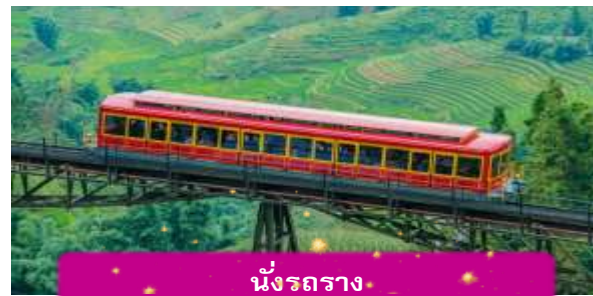
นั่งรถราง

เที่ยง บริการอาหารกลางวัน ณ ภัตตาคาร พิเศษ ... เมนูบุฟเฟ่ฟานซิปัน