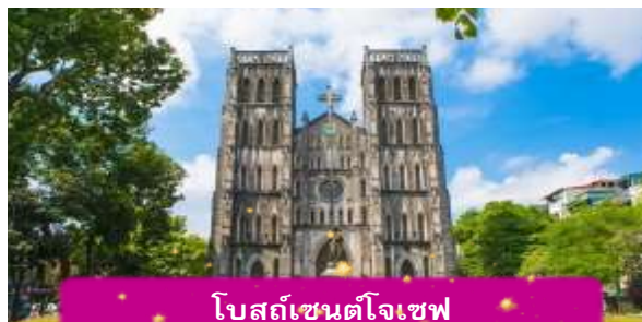
โบสถ์เซนต์โจเซฟ