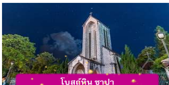
โบสถ์หิน ซาปา