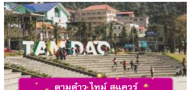
ตามดาว ไทม์ สแควร์

ที่พัก TAMDAO HOTEL ระดับ 3 ดาวมาตรฐานท้องถิ่น หรือเทียบเท่า