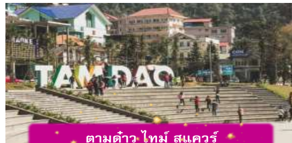
ตามด้าว ไทม์ สแควร์

ที่พัก TAMDAO HOTEL ระดับ 3 ดาวมาตรฐานท้องถิ่น หรือเทียบเท่า