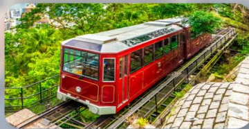
รถรางพักแรม