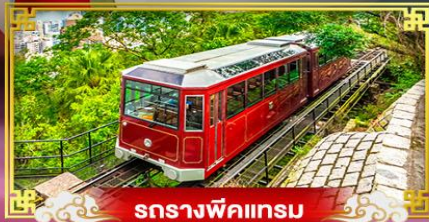
รถรางพิกแรม