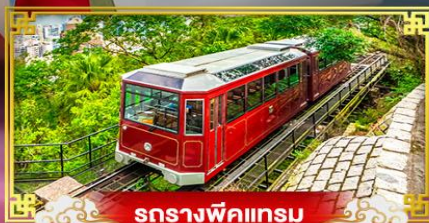
รถรางพิกเกม