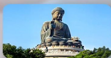
พระใหญ่ฮ่องกง