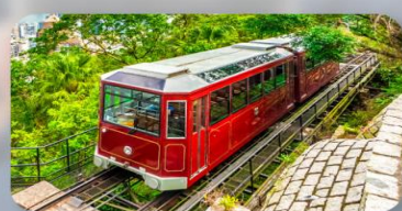
รถรางพิกแตรม