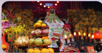
วัดกวนอิมสองฮิม