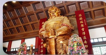
วัดกึงหันแซง