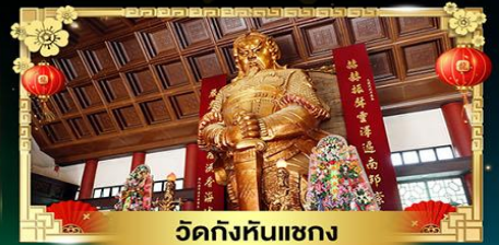
วัดกั๊งหันแซง