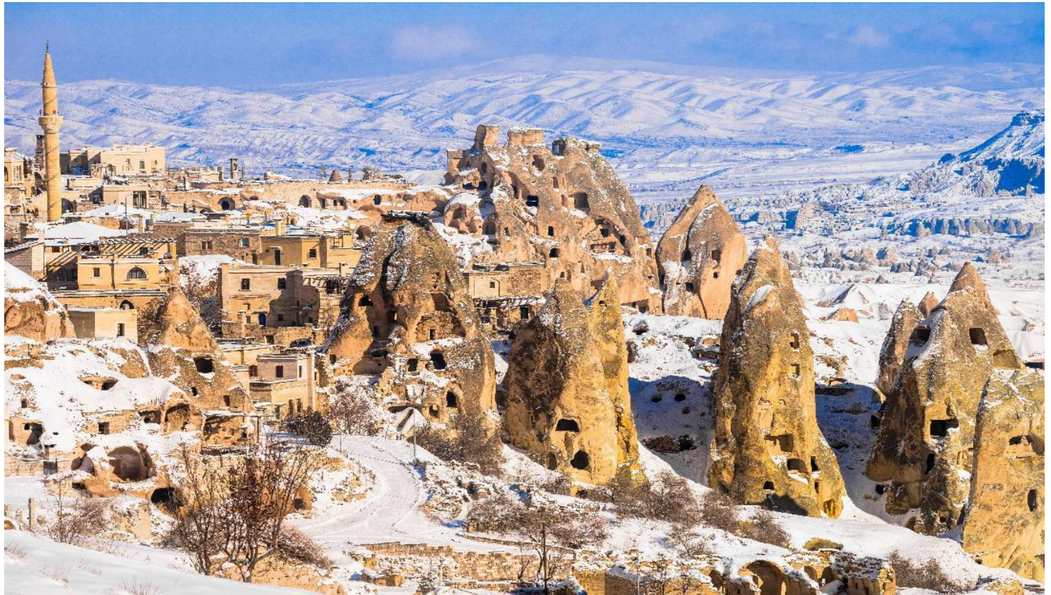
นำท่านชม หมู่บ้านอวานอส (Avanos Villege) เป็นหมู่บ้านเก่าแก่เล็กๆ ตัวบ้านมีลักษณะสถาปัตยกรรมออกโตมัน ดั้งเดิม ตั้งอยู่ริมฝั่งแม่น้ำแดง มีชื่อเสียงในเรื่องของเครื่องปั้นดินเผาและเซรามิก