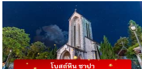
โบสถ์หิน ซาปา