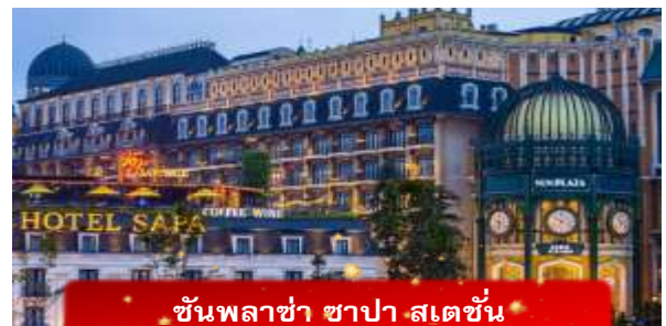
ชันพลาซ่า ซาปา สเตชั่น