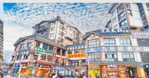
หมู่บ้านโบราณฉือซีโซ่ว

*ทางบริษัทฯ ขอสงวนสิทธิ์ในการสลับโปรแกรมทัวร์ตามความเหมาะสมขึ้นอยู่กับสถานการณ์หน้างาน โดยคำนึงถึงผลประโยชน์ของลูกค้าเป็นสำคัญ