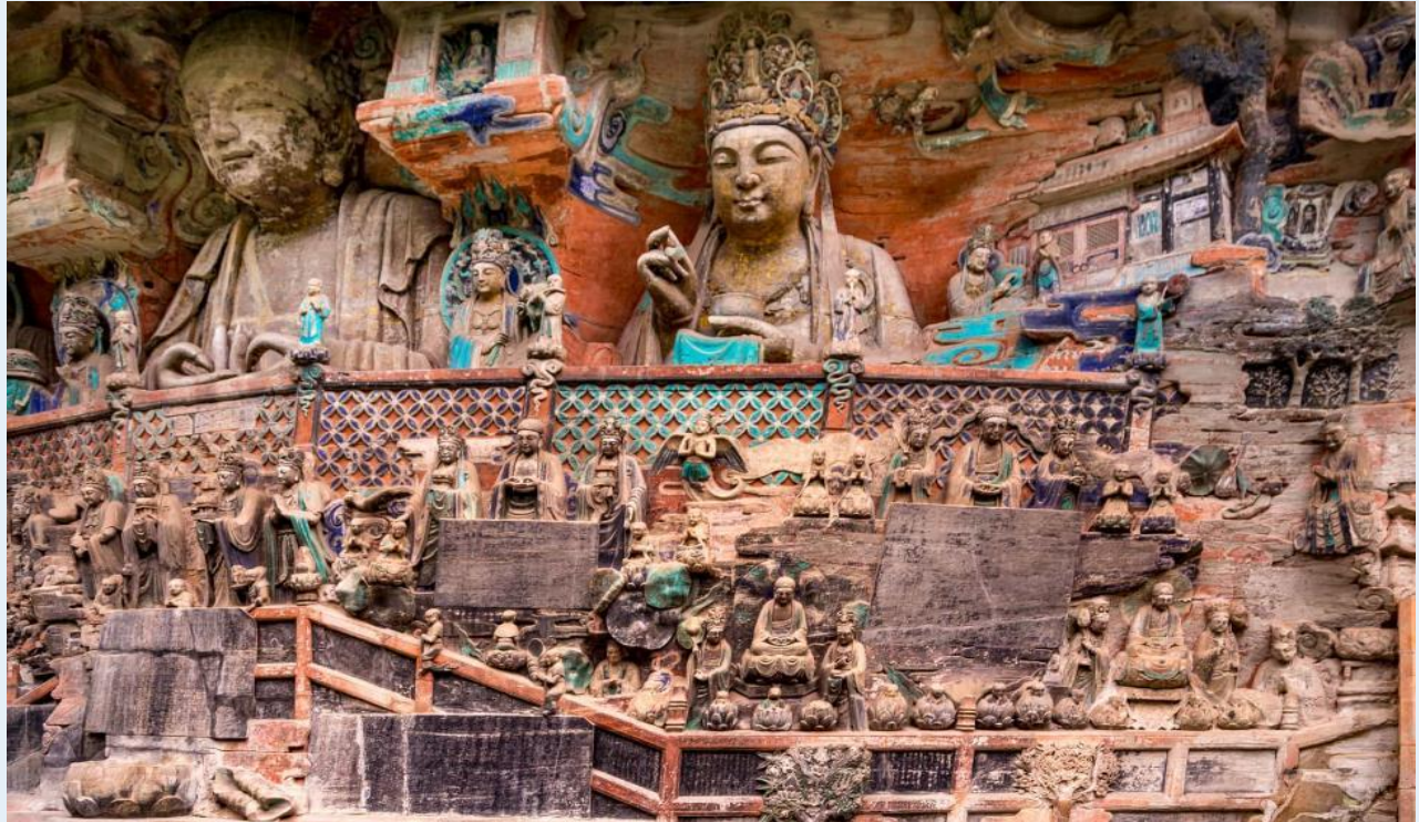
นำท่านเดินทางกลับสู่ นครฉงชิ่ง (CHONGQING) (ใช้เวลาเดินทางประมาณ 2 ชั่วโมง)