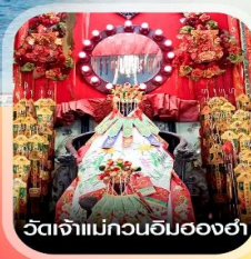
วัดเจ้าแม่กวนอิมสองฮา

✈️ คอนเฟิร์มออกเดินทาง ทุกพีเรียด 2 ท่านขึ้นไป