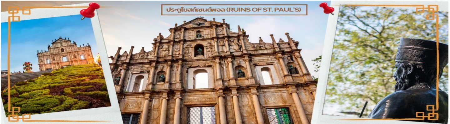
ประตูโบสถ์เซนต์พอล (RUINS OF ST. PAUL'S)

ได้เวลาอันสมควร นำท่านเดินทางสู่ เมืองจูไห่ (ZHUHAI) เป็นเมืองที่มีอาณาบริเวณเขตมหาสมุทรใหญ่ ที่สุด มีเกาะมากที่สุด และมีแนวชายฝั่งทางทะเลยาวที่สุดใน ภูมิภาคสามเหลี่ยมปากแม่น้ำ จูเจียง ซึ่งตั้งอยู่ทางริมฝั่งตะวันตก ของปากแม่น้ำจูเจียง หรือแม่น้ำไข่มุกที่ไหลลงสู่ทะเลจีนใต้ใน มณฑลกว่างตุง ทางตอนใต้ของประเทศจีน