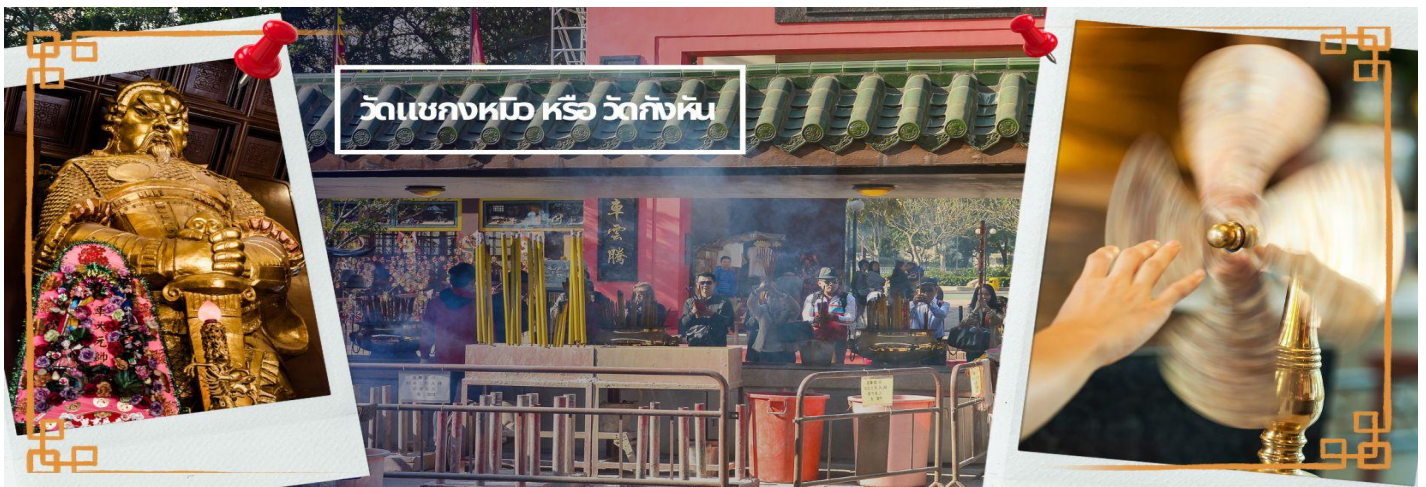
วัดแชกงหมิว หรือ วัดกั้งหัน

จากนั้นนำท่านเดินทางไป วัดแชกงหมิว หรือ วัดกั้งหัน (CHE KUNG TEMPLE) วัดแชกงสร้างขึ้นเพื่อเป็นอนุสรณ์เพื่อรำลึกถึงตำนานแห่งนักรบราชวงศ์ซ่ง มีนามว่า “แช กง” แม่ทัพปราบศึก ผู้คนทั่วทุกดินแดนต่างยำเกรงในกำลังพลอันกล้าหาญแข็งแกร่งของแม่ทัพแชกง เป็นวัดเก่าแก่ที่มีความศักดิ์สิทธิ์มาก มีอายุกว่า 300 ปีตั้งอยู่ในเขต SHATIN มีประวัติเล่าต่อกันมาว่า ขณะที่แม่ทัพปราบศึกอยู่นั้น ทุกแคว้นเขตแดนแผ่นดินใหญ่ต่างก็ยำเกรงต่อกำลังพลที่กล้าหาญในกองทัพของท่าน ยามที่ออกรบเพื่อต้านข้าศึกศัตรูทุกทิศทาง ทุก ๆ ครั้ง ท่านใช้สัญลักษณ์รูปกั้งหัน 4 ใบพัดติดไว้ด้านหลังรถศึกนำขบวนในกองทัพ เหล่าทหารกล้ามีความเชื่อว่าเมื่อพก พาสัญลักษณ์รูปกั้งหันนี้ไป ณ ที่ใด ๆ กั้งหันนี้จะช่วยเสริมสิริมงคล นำพาแต่ความโชคดี เสริมกำลังใจให้แก่กองทัพของท่าน ชื่อเสียงในการนำทัพผู้ศึกของท่านจึงเป็นตำนานมาจนทุกวันนี้ ปัจจุบันวัดแชกง จึงเป็นสถานที่สักการะเคารพ ขอพร ท่านแชกง โดยมีสัญลักษณ์เป็นกั้งหันนำโชค