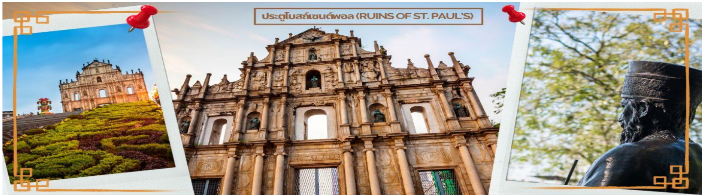
ประตูโบสถ์เซนต์พอล (RUINS OF ST. PAUL'S)

ได้เวลาอันสมควร นำท่านเดินทางสู่ เมืองจูไห่ (ZHUHAI) เป็นเมืองที่มีอาณาบริเวณเขตมหาสมุทรใหญ่ ที่สุด มีเกาะมากที่สุด และมีแนวชายฝั่งทางทะเลยาวที่สุดใน ภูมิภาคสามเหลี่ยมปากแม่น้ำ จูเจียง ซึ่งตั้งอยู่ทางริมฝั่งตะวันตก ของปากแม่น้ำจูเจียง หรือแม่น้ำไข่มุกที่ไหลลงสู่ทะเลจีนใต้ใน มณฑลกวางตุ้ง ทางตอนใต้ของประเทศจีน