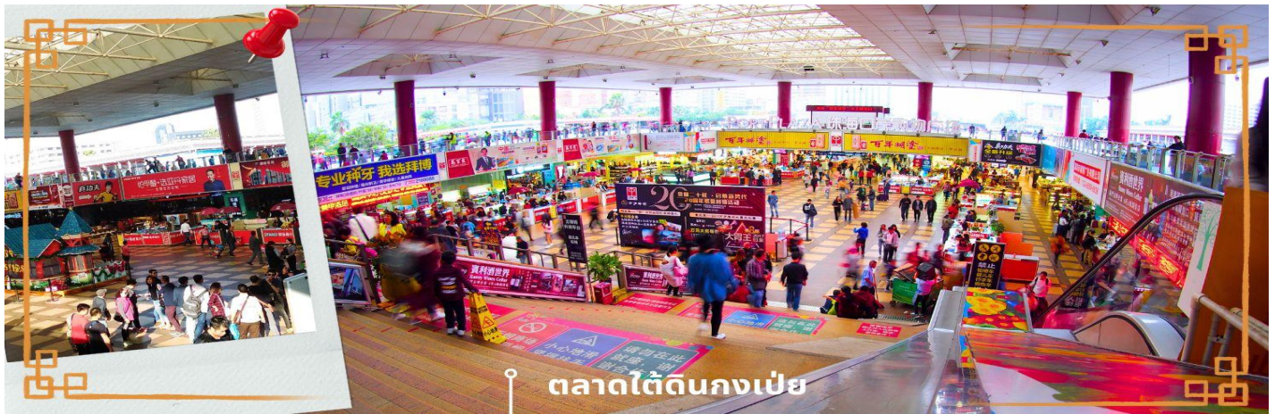
ตลาดใต้ดินกงเป่ย

เย็น ๑๐ บริการอาหารเย็น ณ ภัตตาคาร (4) โรงแรมที่พัก นำท่านเข้าสู่ที่พัก IRVINE HOLIDAY HOTEL หรือเทียบเท่า