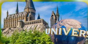
เลือกอิสระ Universal Studios Japan

HOTEL TETORA KYOTO EKIMAE หรือเทียบเท่ามาตรฐานญี่ปุ่น IZUMINO CENTER HOTEL หรือเทียบเท่ามาตรฐานญี่ปุ่น IZUMINO CENTER HOTEL หรือเทียบเท่ามาตรฐานญี่ปุ่น