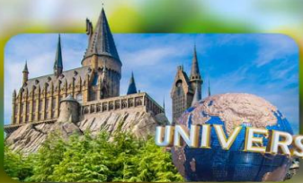
เลือกอิสระ Universal Studios Japan