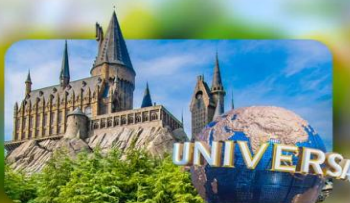
เลือกอิสระ Universal Studios Japan