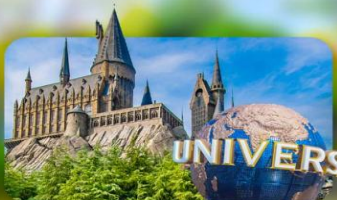
เลือกอิสระ Universal Studios Japan