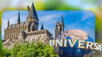
เลือกอิสระ Universal Studios Japan