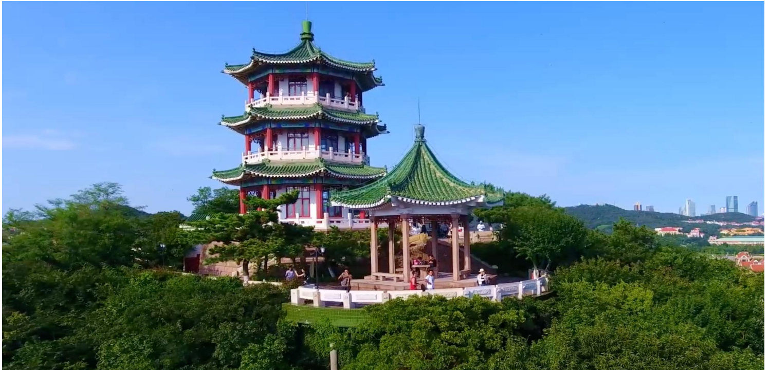
สุดคลาสสิก ปาต้ากวน (Badaguan) ถนนปาต้ากวน หรือ “ถนนแปดสาย” เป็นจุดรวมของถนน 8 สายที่ตั้งชื่อตามด้านกำแพงเมืองจีน บรรยากาศเงียบสงบ ร่มรื่น รายล้อมด้วยอาคารสไตล์ยุโรปกว่า 200 หลัง ทำให้ถ่ายรูปออกมาได้ฟีลยุโรปสุดๆ