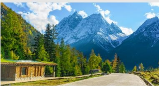
ภูเขาซีตงรุณี (หุบเขาชวงเจียวโกว)