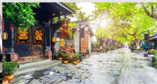
ซอยกว้างชอยแคบ