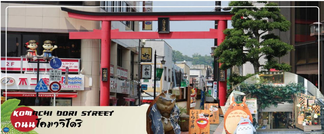
KOMACHI DORI STREET ถนนโคมาจิโดริ

บริเวณใกล้เคียงกัน ถนนโคมาจิโดริ (Komachi Dori Street) ตลอดระยะทางราวๆ 350 เมตร ของถนนโคมาจิโดรินี้ เต็มไปด้วยร้านค้าละลานตากว่า 250 ร้าน ไม่ว่าจะเป็นร้านอาหารท้องถิ่น ร้านขายของที่ระลึก ร้านเช่ากิโมโน คาเฟ่แสนน่ารัก ร้านหนังสือ สินค้าทำมือ ขนมญี่ปุ่นโบราณที่หากินได้ยากจากที่อื่น ร้านค้าส่วนมากยังอนุรักษ์รูปแบบอาคารดั้งเดิม ให้ความรู้สึกราวกับเดินในเมืองเก่าของญี่ปุ่น ร้านค้าบางสวนก็ปรับปรุงเปลี่ยนแปลงตามยุคสมัย