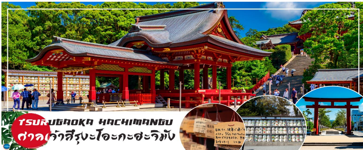
TSURUGAOKA HACHIMANGU ศาลเจ้าสี่รุเงโอะกะสะจิมัง

วันที่สอง ท่าอากาศยานนานาชาตินาริตะ – เมืองคามาคุระ – ศาลเจ้าสี่รุเงโอะกะ สะจิมัง – ถนนโคมาจิโดริ – เกะเอโนชิมะ – ศาลเจ้าเอโนชิมะ – ถนนเบนไซเท็นนากามิเสะ – เมืองยามานาชิ – ออนเซ็น