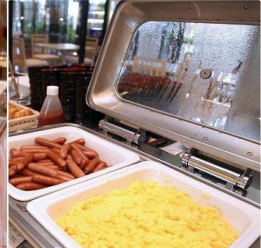
Asia Narita Hotel