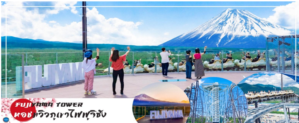
FUJIYAMA TOWER ห้องวิวภูเขาไฟฟูจิซัง

เที่ยง อิสระรับประทานอาหารกลางวัน ณ ห้องอาหารฟูจิคิวไฮแลนด์ (3) Meal Coupon