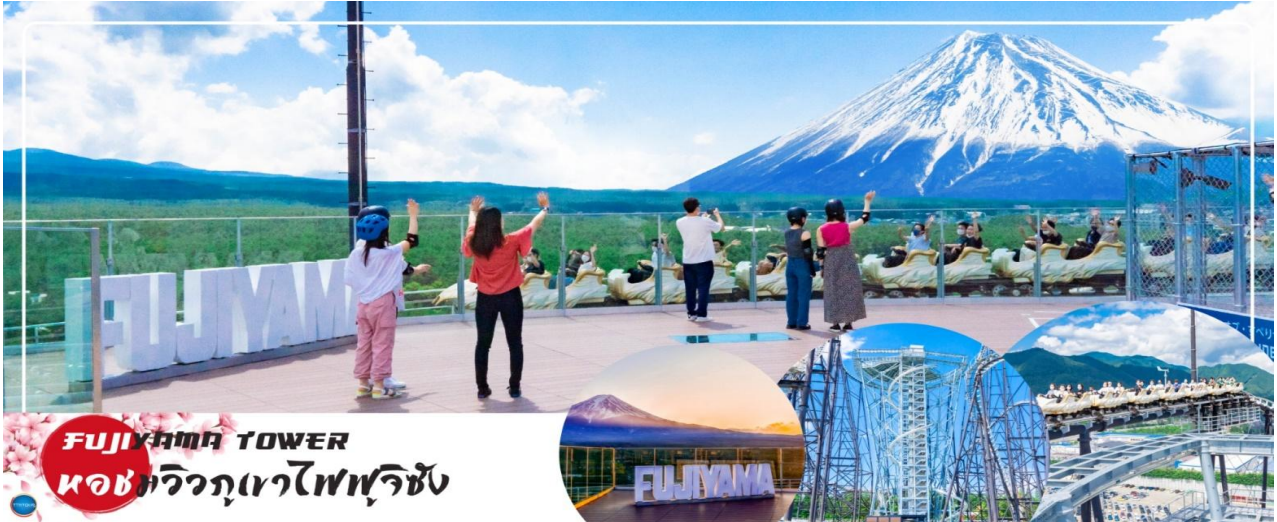
FUJIYAMA TOWER ห้องวิวภูเขาไฟฟูจิซัง

เที่ยง อิสระรับประทานอาหารกลางวัน ณ ห้องอาหารฟูจิคิวไฮแลนด์ (3) Meal Coupon