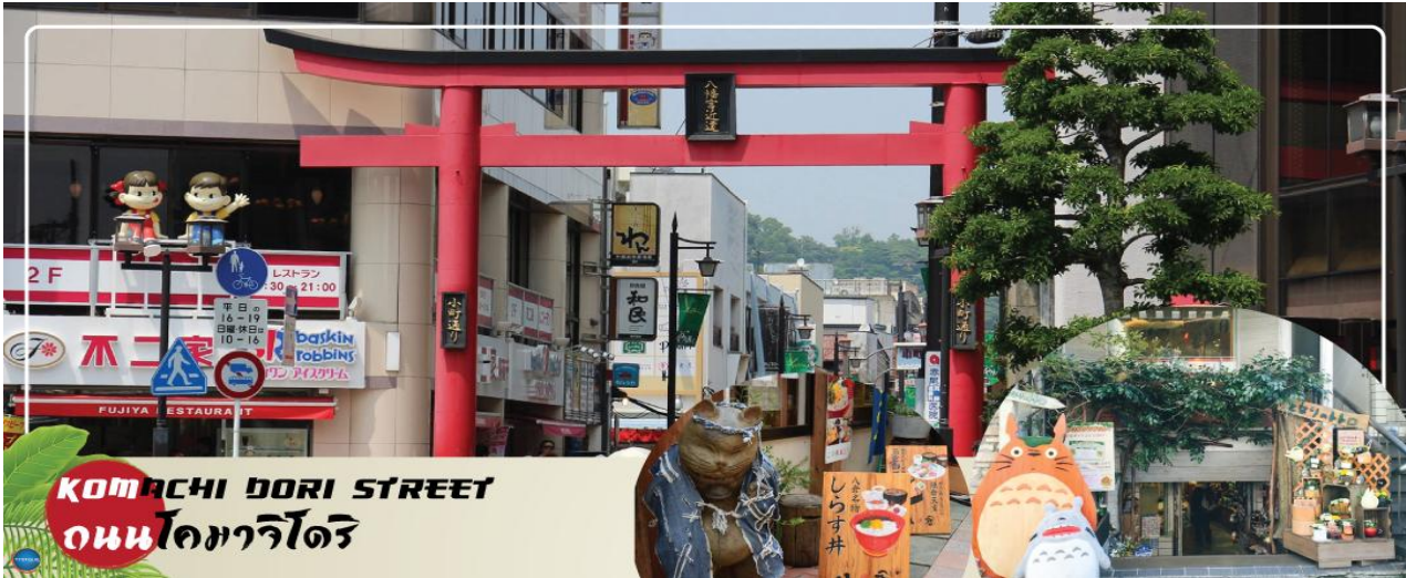
KOMACHI DORI STREET ถนนโคมาจิโดริ

บริเวณใกล้เคียงกัน ถนนโคมาจิโดริ (Komachi Dori Street) ตลอดระยะทางราวๆ 350 เมตร ของถนนโคมาจิโดรินี้ เต็มไปด้วยร้านค้าละลานตากว่า 250 ร้าน ไม่ว่าจะเป็นร้านอาหารท้องถิ่น ร้านขายของที่ระลึก ร้านเช่ากิโมโน คาเฟ่แสนน่ารัก ร้านหนังสือ สินค้าทำมือ ขนมญี่ปุ่นโบราณที่หากินได้ยากจากที่อื่น ร้านค้าส่วนมากยังอนุรักษ์รูปแบบอาคารดั้งเดิม ให้ความรู้สึกราวกับเดินในเมืองเก่าของญี่ปุ่น ร้านค้าบางสวนก็ปรับปรุงเปลี่ยนแปลงตามยุคสมัย