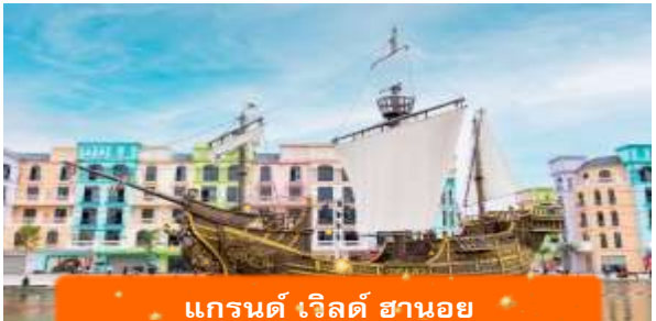
แกรนด์ เวิลด์ ฮานอย

เที่ยง บริการอาหารกลางวัน ณ ภัตตาคาร นำท่านเช็คอิน แกรนด์ เวิลด์ ฮานอย แลนด์มาร์กใหม่ที่กำลังมาแรงในฮานอย แหล่งรวม ไลฟ์สไตล์ การช้อปปิ้ง ศิลปะ และความบันเทิงแบบครบวงจร ด้วยสถาปัตยกรรมที่ ทันสมัยและการตกแต่งสไตล์ยุโรป ทำให้นี่กลายเป็นจุดถ่ายรูปยอดนิยม ทั้งกลางวันและ กลางคืน เหมาะสำหรับนักท่องเที่ยวสายถ่ายรูป ช้อปปิ้ง และคนที่อยากสัมผัสวิถีชีวิตของ ฮานอยที่มีความร่วมสมัย นำท่านชมสินค้า OTOP ผ้าไหม