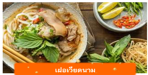
เฟอเวียดนาม

เที่ยง บริการอาหารกลางวัน ณ ภัตตาคาร พิเศษ ... เมนูเฟอโกเวียดนาม ได้เวลาอันสมควรนำท่านเดินทางเข้าสู่ สนามบินนอยไบ เพื่อเดินทางกลับประเทศไทย 15.55 นำท่านเดินทางสู่ สนามบินสุวรรณภูมิ ประเทศไทย เที่ยวบินที่ VN619 (บริการอาหาร และเครื่องดื่มบนเครื่อง) 17.55 เดินทางถึง สนามบินสุวรรณภูมิ ประเทศไทย โดยสวัสดิภาพ ... พร้อมความประทับใจ