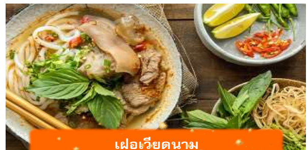
เฟอเวียดนาม

เที่ยง บริการอาหารกลางวัน ณ ภัตตาคาร พิเศษ ... เมนูเฟอโกเวียดนาม ได้เวลาอันสมควรนำท่านเดินทางเข้าสู่ สนามบินนอยไบ เพื่อเดินทางกลับประเทศไทย 15.55 นำท่านเดินทางสู่ สนามบินสุวรรณภูมิ ประเทศไทย เที่ยวบินที่ VN619 (บริการอาหาร และเครื่องดื่มบนเครื่อง) 17.55 เดินทางถึง สนามบินสุวรรณภูมิ ประเทศไทย โดยสวัสดิภาพ ... พร้อมความประทับใจ