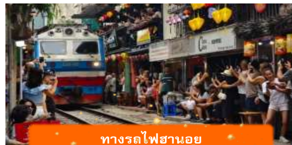
ทางรถไฟฮานอย

เที่ยง บริการอาหารกลางวัน ณ ภัตตาคาร พิเศษ ... เมนูเฟอโกเวียดนาม ได้เวลาอันสมควรนำท่านเดินทางเข้าสู่ สนามบินนอยไบ เพื่อเดินทางกลับประเทศไทย 15.55 นำท่านเดินทางสู่ สนามบินสุวรรณภูมิ ประเทศไทย เที่ยวบินที่ VN619 (บริการอาหาร และเครื่องดื่มบนเครื่อง) 17.55 เดินทางถึง สนามบินสุวรรณภูมิ ประเทศไทย โดยสวัสดิภาพ ... พร้อมความประทับใจ