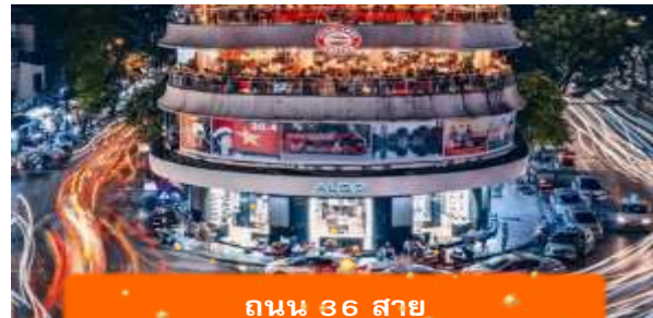
ถนน 36 สาย