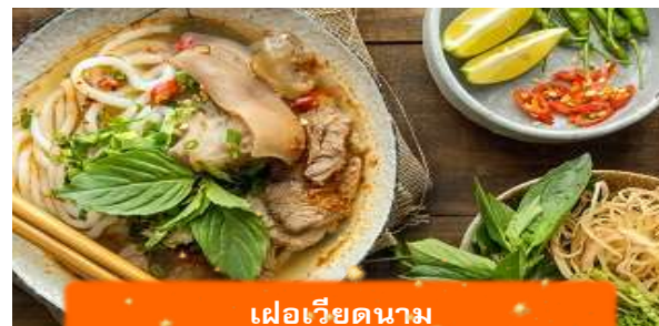
เฟอเวียดนาม