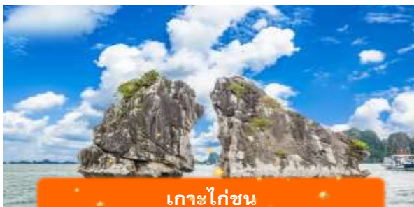
เกาะไก่ชน

เช้า บริการอาหารเช้า ณ ห้องอาหารของโรงแรม หลังอาหารเช้านำท่านเดินทางสู่ท่าเรือเพื่อ ล่องเรือฮาหลงเบย์ ไฮไลท์ของเวียดนามเหนือ การล่องเรือท่ามกลางอ่าวที่เต็มไปด้วยเกาะหินปูนมากกว่า 1,600 เกาะ บางเกาะมีรูปร่างแปลกตาเหมือนสัตว์หรือวัตถุ สายน้ำสีฟ้าใสสะท้อนท้องฟ้าและภูเขาเหมือนภาพวาด การได้ล่องเรือชมพระอาทิตย์ขึ้นหรือตกในอ่าวแห่งนี้คือประสบการณ์ที่อยากจะลืม มีทั้งเรือแบบครึ่งวัน เต็มวัน หรือพักค้างคืนให้เลือกตามใจ นำท่านแวะชม เกาะไก่ชน หนึ่งในแลนด์มาร์กที่ทุกเรือต้องผ่าน เกาะหินปูนที่มีรูปร่างเหมือนไก่สองตัวกำลังจิกกันอยู่กลางอ่าว ถูกใช้เป็นสัญลักษณ์ของฮาหลงเบย์มานานหลายสิบปี นำท่านชม ถ้ำสวรรค์ ถ้ำหินปูนขนาดใหญ่ที่ซ่อนอยู่ในเกาะกลางอ่าว ภายในถ้ำเต็มไปด้วยหินงอกหินย้อยรูปร่างแปลกตา มีการติดตั้งแสงไฟหลากสีอย่างสวยงามราวกับอยู่ในพระราชวังใต้ดิน เที่ยง บริการอาหารกลางวัน ณ ภัตตาคาร พิเศษ ... เมนูซีฟู้ดบนเรือ