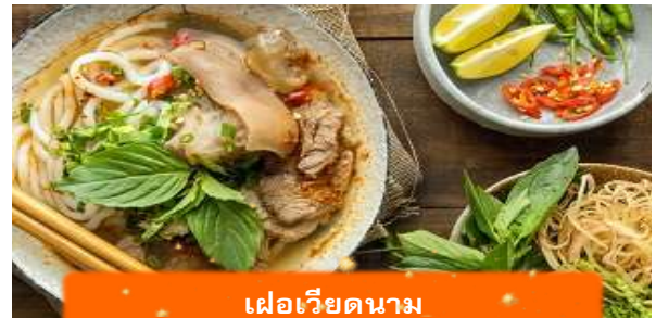
เฟอเวียดนาม