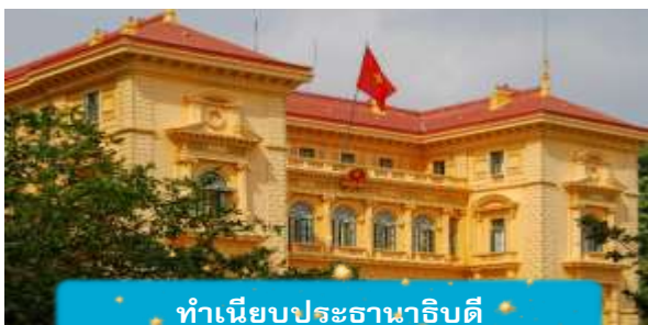
ทำเนียบประธานาธิบดี