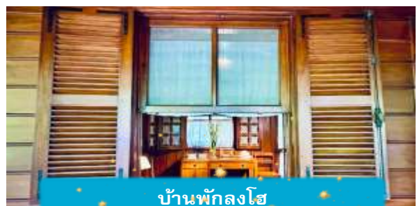
บ้านพักลุงโฮ