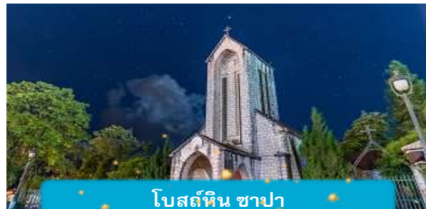
โบสถ์หิน ซาปา