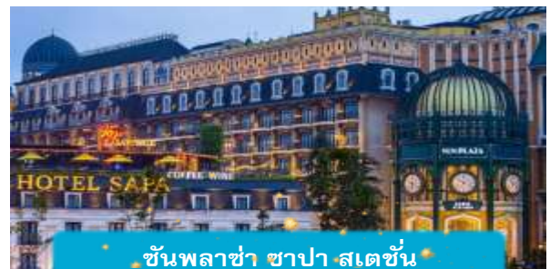
ชั้นพลาซ่า ซาปา สเตชั่น