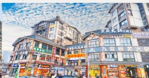
หมู่บ้านโบราณฉือซีโซ่ว

*ทางบริษัทฯ ขอสงวนสิทธิ์ในการสลับโปรแกรมทัวร์ตามความเหมาะสมขึ้นอยู่กับสถานการณ์หน้างาน โดยคำนึงถึงผลประโยชน์ของลูกค้าเป็นสำคัญ