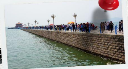
สะพานจ้านเฉียว