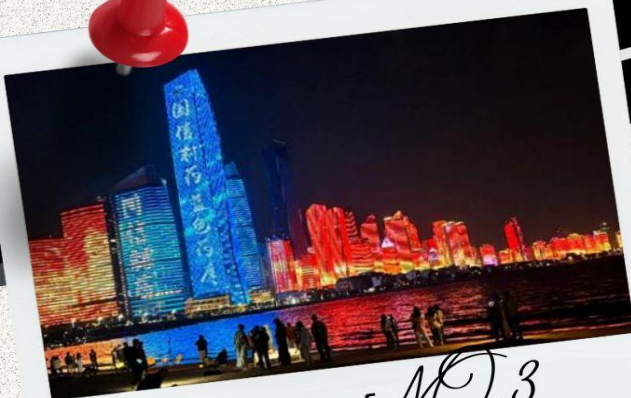
หาดไซเบอร์ NO.3