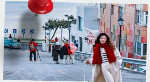
ถนนฮั่วจวีปา