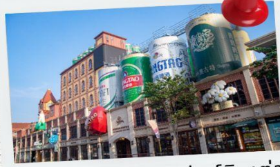
พิพิธภัณฑ์เบียร์ซิงเต่า