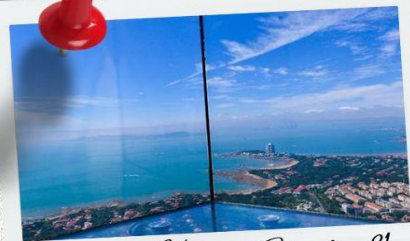
Qingdao Haitian Center ชั้น 81